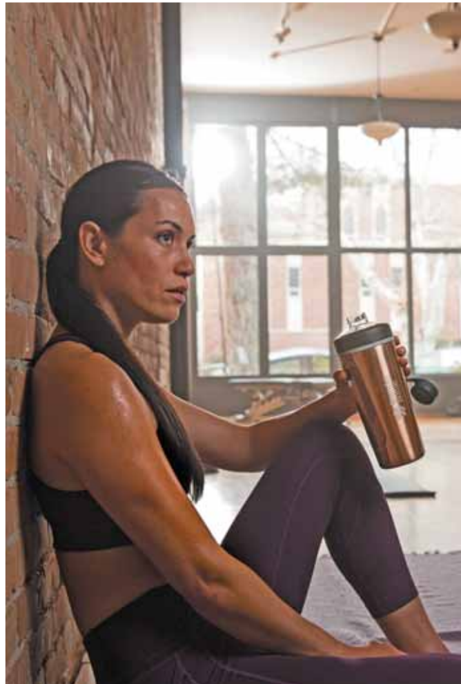
Beim Workout immer mit dabei: der praktische und robuste Behälter aus Thermo-Edelstahl.

Ausreichendes Trinken vor, während und nach dem Sport hilft dabei, durch Schwitzen verlorene Flüssigkeit und Mineralien zu ersetzen. Wasser, Kräutertees und Fruchtsaftchorlen mit einem Verhältnis von drei Teilen Wasser zu einem Teil Saft sind gute Durstlöscher. Da alkoholfreies Weizenbier isotonisch wirkt, ist es bei Sportlern nach dem Training besonders beliebt. Viele Sportler mixen sich ihr Sportgetränk