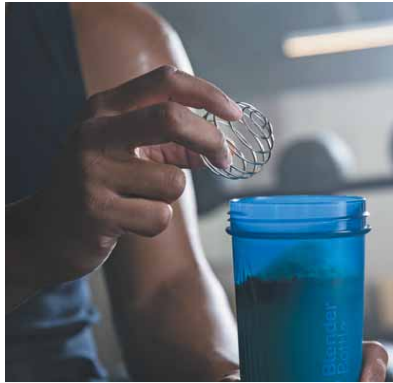
Die Edelstahl-Schneebecken-Kugel im Shaker sorgt bei kräftigem Schütteln dafür, dass alle Zutaten cremig verrührt werden.

auch selbst – aus Wasser, Traubenzucker und Natrium, das in Kochsalz enthalten ist. Wer starken Muskelaufbau betreibt, sollte im Anschluss an das Training beispielsweise eiweißreiche Shakes zu sich nehmen.