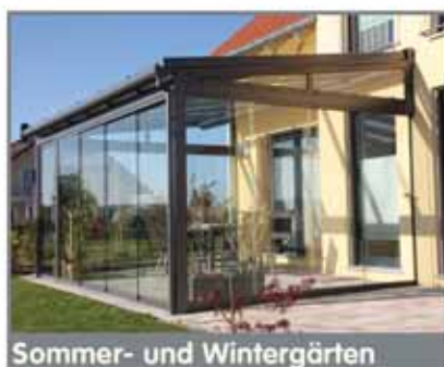
Sommer- und Wintergärten