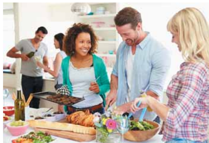
Gesund, leicht und lecker sollen die Gerichte in der warmen Jahreszeit sein. Foto: djd/www.erasco.de/thx

Tortillas zusammenrollen. Mit Limetten-Dip servieren. djd