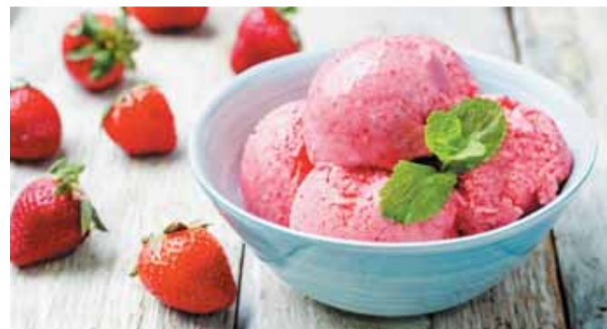
Erdbeereis auf Joghurtbasis findet als Dessert viele begeisterte Liebhaber.

Für einen leckeren Mix aus Frucht und Joghurt werden erst einmal 350 Gramm frische Erdbeeren gewaschen und geviertelt. Dann gibt man 50 Gramm Zucker, das Mark einer halben Vanilleschote und einen Esslöffel Limettensaft dazu und verrührt die Zutaten so lange, bis sich der Zucker gelöst hat. Der Mix wird im Stabmixer fein püriert und schließlich mit 350 Gramm Rahmjoghurt mit einem Fettanteil von zehn Prozent oder mit der gleichen Menge griechischen Joghurts verrührt. Wer eine Eismaschine besitzt, gefriert die Mischung darin je nach Geräte-Anweisung circa 20 bis 30 Minuten. Ohne Eismaschine kann man die Masse einfach in eine Gefrierschale mit Deckel füllen und in das Gefrierfach stellen. Es kann zwei bis drei Stunden dauern, bis das Eis fest ist. Während der Gefrierzeit sollte das Eis etwa alle 30 Minuten gut durchgerührt werden.