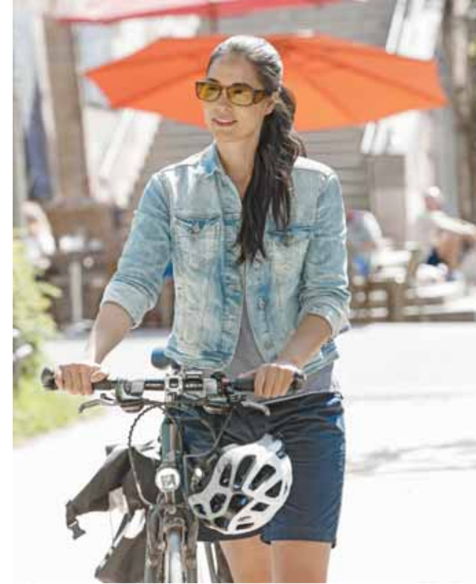
Spezielle Brillen mit Kantenfiltern schützen die Augen vor intensiver Sonneneinstrahlung und sorgen für ein entspanntes, kontrastreiches und blendfreies Sehen.