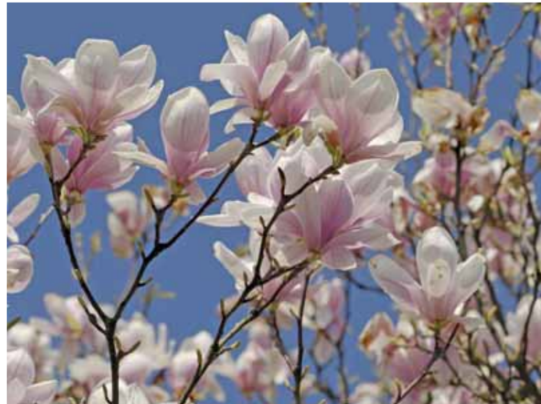
Eine blühende Magnolie verzaubert jeden Garten.

Graue Steinwüsten im Garten sind selten geeignet, eine wirklich einladende Stimmung zu verbreiten. Bienenweiden dagegen sind nicht nur für die Augen ein Fest der Sinne – sondern auch für Bienen und Hummeln ein idealer Lebensraum. Mit Bienen-